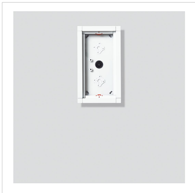
Opbouwbehuizing GA 612-2/1-0 SM 200039106-00