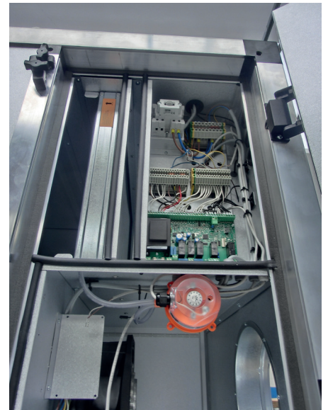
01APS-10R zur Filterüberwachung

Mehr über unser weiteres Sensor-Sortiment erfahren Sie unter www.belimo.eu/sensors .